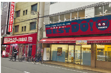
オープン予定のオタロード中央店(右)と既存の日本橋本店(左) (4月下旬撮影)

今でこそトレカ専門店の目立つ日本橋だが、ドラスタは其中でも先駆者的な存在としていち早く2008年に進出(現在の日本橋本店)。その後も2016年の日本橋2号店(なんさん通り沿い)、2021年にも日本橋3号店(南海電鉄高架下「EKIKAN」内)を出店し店舗網を拡大、愛好者の間でも高い知名度を得ている。ちなみに現在、日本橋には約40店舗のトレカ専門店