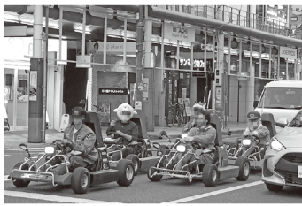
日本橋の街で、このような光景を見ることも珍しくなくなった(画像を一部加工しています)

コロナ禍の影響で長期休業状態となっていた、公道走行用カートのレンタル専門店「アキバカート大阪」が、今年に入って営業を再開していることが明らかになった。