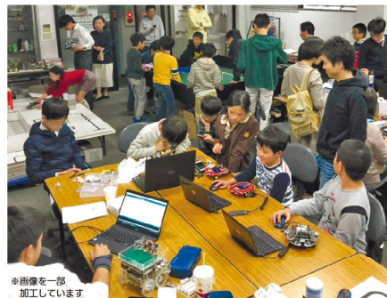
※画像を一部加工しています

【Space Gratus】 大阪市浪速区日本橋4-15-17 アニメイト大阪日本橋別館3階 https://www.animate.co.jp/shop/nipponbashi/ Twitter: @animatedenden