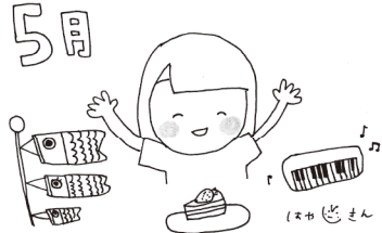
はやしさん (@superhayashi) ◆2008年活動開始。よしもとボードゲームP1所属。糞砂と花粉にやられ中。

相変わらずオーディションを受け、アルバイトをする日々です。悩みながらも良い報告ができることを祈り、楽しい15年目をすごしたいと思えます。ちょっとはお仕事で食べられたらいいな。今年度もよろしくお願致します！