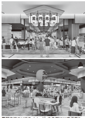
黒門市場エリアのイメージ。中央部には椅子席も多数配置され、フードコートとしての利用も可能 ※本人の事情で実際の施設内写真が使えず、オープン直前のプレスリリースでのイメージ画像を使用しています