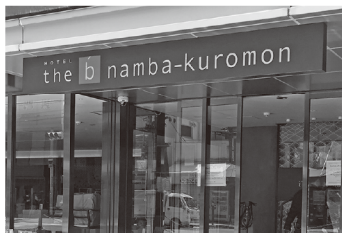
駅前面した入口ではすでに看板を差し替え(4月下旬撮影)

地下鉄日本橋駅近くの旧「ホテルWBF なんば黒門」が、名称も新たに「the b (ザ・ビー) なんば黒門」へと生まれ変わり、6月15日にオープンする。自社サイトと、ホテル予約サイト大手各社を通しての先行予約受付も3月31日より始まった。