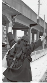
最近、インスタグラムの「インサイト」の数字追っかけを始めたマスクさんのTwitterは⇒@fukumenjoshi

さて大阪では例の商店街で大きなカニカマスティックの販売が復活するなど、所謂コロナ前に戻りつつあると風の便りに聞いておりますが、それでも新型コロナウイルスへの感染は厄介であることに違いありません。皆さま引き続きご自愛くださいませ。