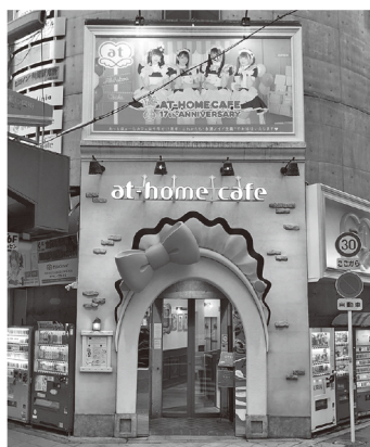
【あっとほおーむカフェ 大阪本店】 大阪市浪速区日本橋4-9-13 SEMビル https://www.cafe-at-home.com/ Twitter : @athome_cafe

今回の増床では、これまで「大阪本店」「大阪本店2F」の2フロア構成となっていたカフェをさらに1フロア拡大、新たに「大阪本店3F」としてオープン。客席数は約30席増加、合計で最大約90名まで対応可能な、日本橋のみならず大阪でも最大規模のメイドカフェとなった。